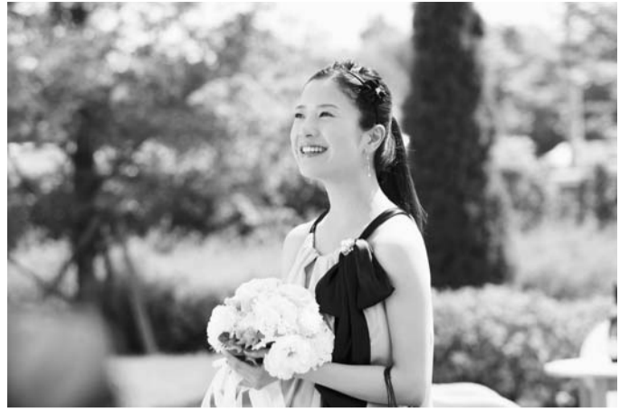
「婚前特急」 ©「婚前特急」フィルム・パートナーズ

中区住吉町4-42-1 ☎045-662-1221 JR・地下鉄 関内駅5分 みなとみらい線 馬車道駅3分